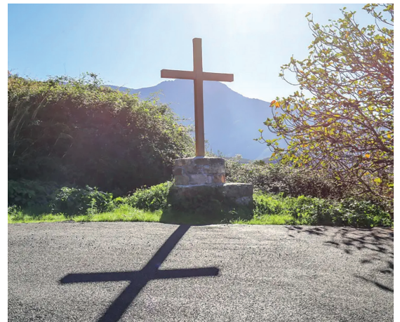
Un calvāriu di paese, cum'eddi n'esistenu più di una cintinaia in Corsica – Quì, quellu di Montegrossu, in Balagna

U sicularisimu hè un cuncettu universale basatu annant'ā dui principi di primura: a separazione di e chjese è u Statu è a libertā di crede o micca. Quesa ùn rimette micca in dubbitu e rialtā tradizionale mintuvati più altu. Tuttavia, ghjè vera chì ssu principiu si manifesteghjā di manera sfarente di un paese à l'altru, tinendu contu di a stòria e di i cuntesti. Cusì, tocc'ā noi di fā a prumuzione di un mudellu Corsu di «laicità». U sicularisimu francese ùn facendu mai riferenza à u fattu culturale, hè à spessu l'ughjettu di cuntruversie, d'interpretazioni variabili è consideratu cum'è ipòcritu. Per contu nostru, à cuntrariu, puderiamu immaghinā ricunosce un purrede cattòlicu è tradizione è usi pagani cum'è parte integrale di u patrimoni stòricu è culturale di u nostru paese.