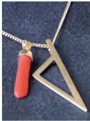
U medaglione incù «A manu di curaddu», un simbolu forte di a nostra «paganità» sempre prisente