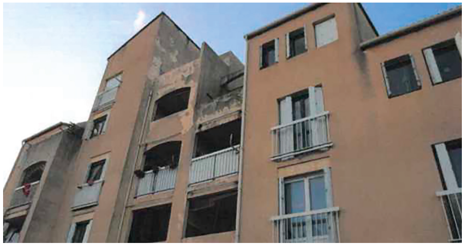
Logement social délabré – Quartier de Bodiccione à Ajaccio

Per noi a risposta hè chjara : « campà corsu ».