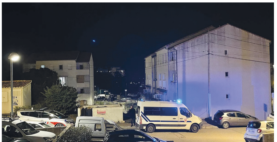
Les quartiers de Paese Novu et Montesoru à Bastia – Théâtres des tristes évènements de janvier 2024