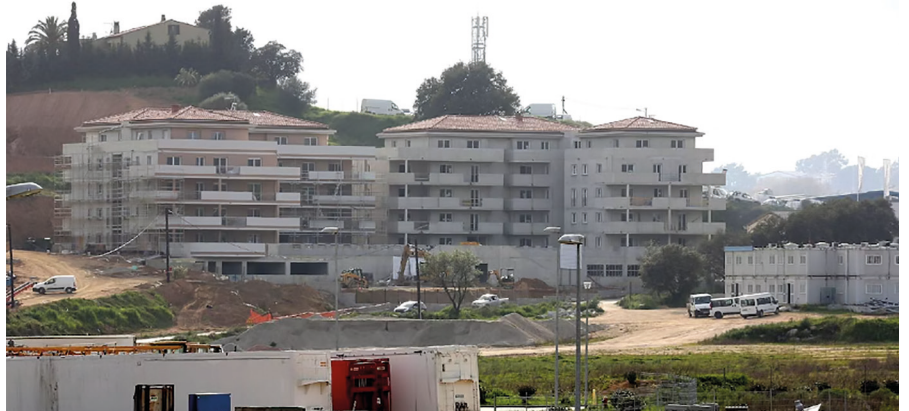
Le «nouveau quartier» de Baleone dans le Pays ajaccien